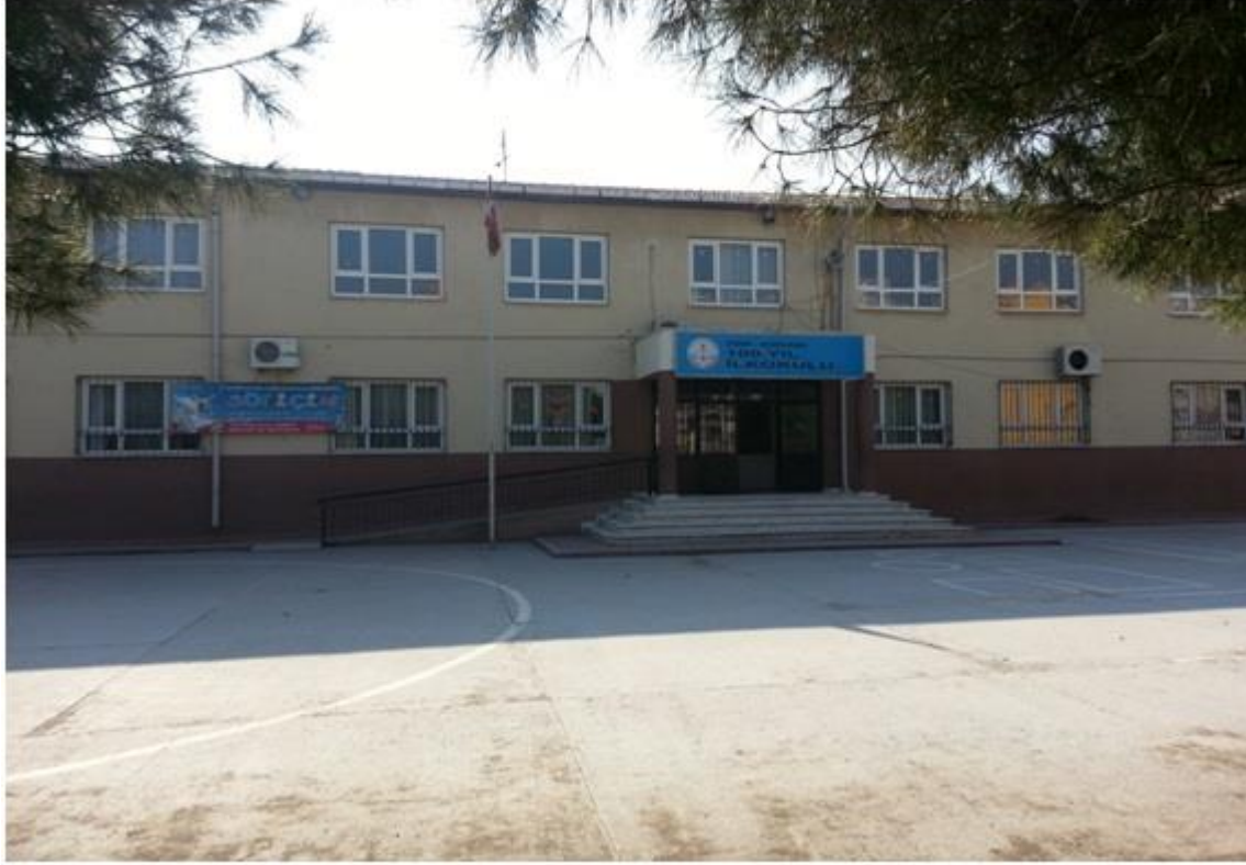
BERGAMA 100. YIL İLKOKULU